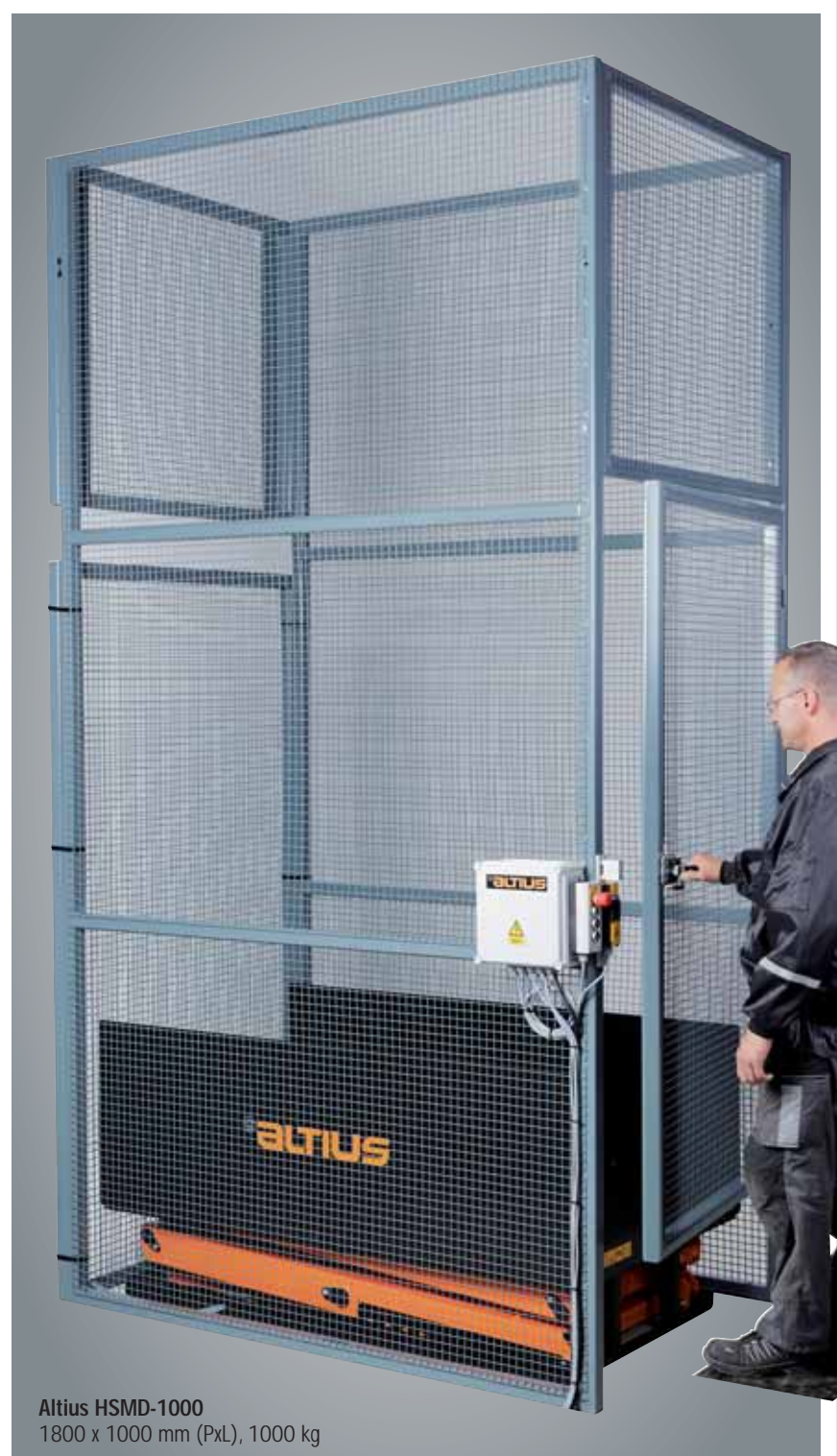
Altius HSMD-1000 1800 x 1000 mm (PxL), 1000 kg

Altius-tavaralavahissien ovet ja portit ovat kaikki varustettu turvalukolla, joka sallii kuluiin pääsemisen ainoastaan Altius-tavaralavahissin ollessa lastaus- tai purkamistilanteen kerroksessa.