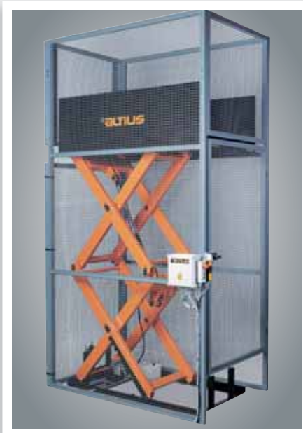
Tavaralavahissi päällekkäisaksisella rakenteella, jolla voitiin helposti ratkaista siirto-ongelmat kahden kerroksen välillä.