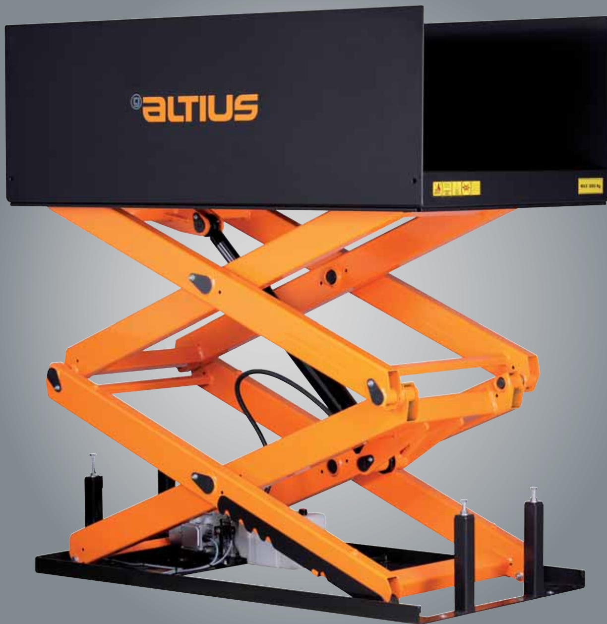
Altius HSSD-1000 2300 x 1250 mm (PxL), 1000 kg

Joustavaa ja tehokasta tavaran- käsittelyä