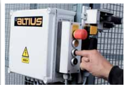
Ohjauskeskus ja käyttölaite.